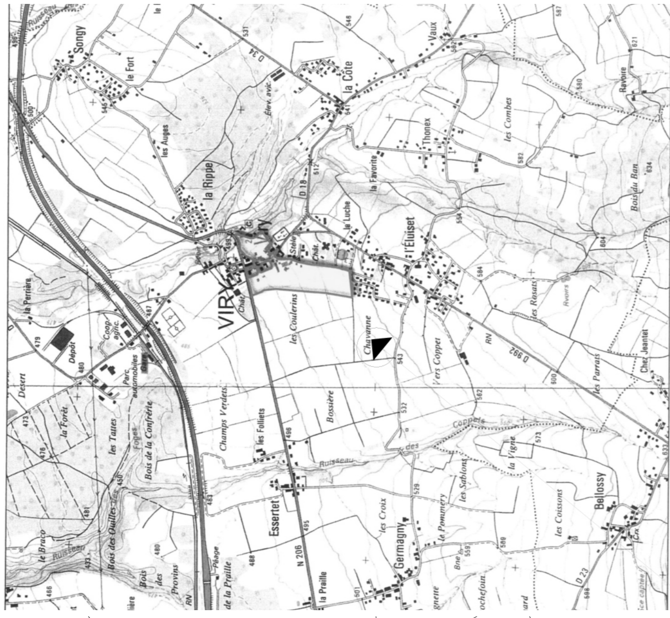
Plan de situation Ech. 1/25000e