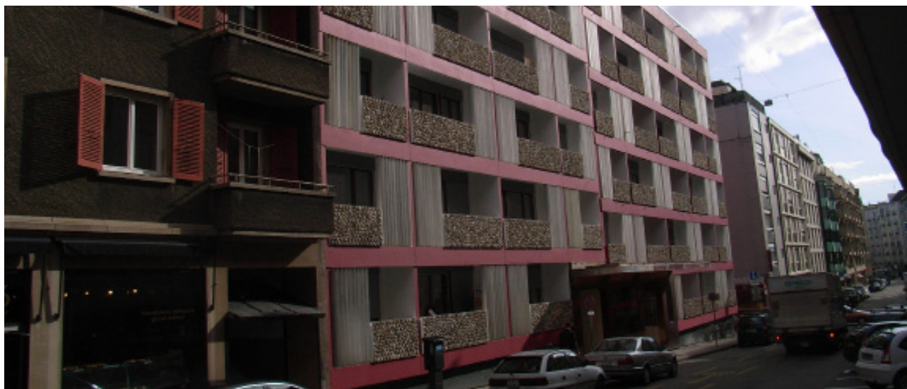
Façade et entrée de l'immeuble Carlton