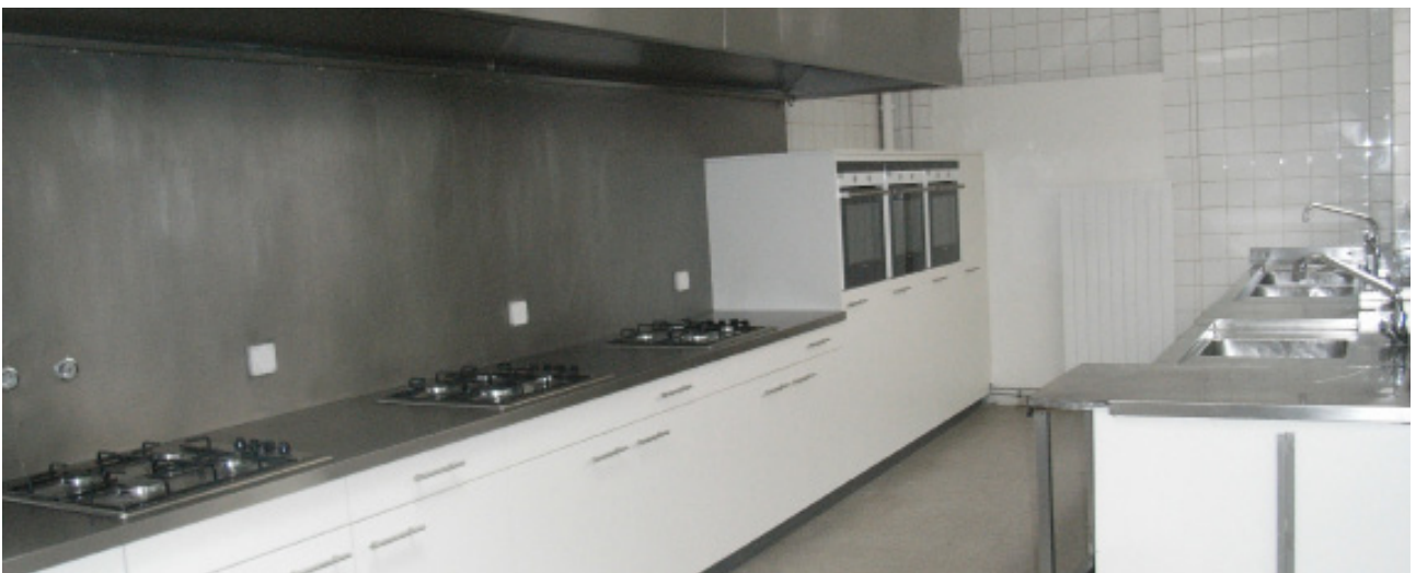
Cuisine adjacente à la salle commune

Ces activités devraient idéalement tenir compte du contexte (immeuble d'habitation) et si possible s'intégrer avec son utilisation actuelle. Nous aimerions donc, dans la mesure du possible , que cet espace puisse toujours être à disposition des habitants, notamment pour organiser des soirées, anniversaires, etc. (selon des modalités également négociables : horaires, jours, etc.).